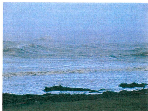
Ved stormflod sikrer beredskabet, at evakuerede kan få et sted at opholde sig.